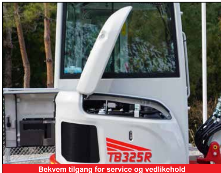
Bekvem tilgang for service og vedlikehold

*Funksjonene kan være utilgjengelige i noen land. Kontakt din Takeuchi-forhandler for mer informasjon.