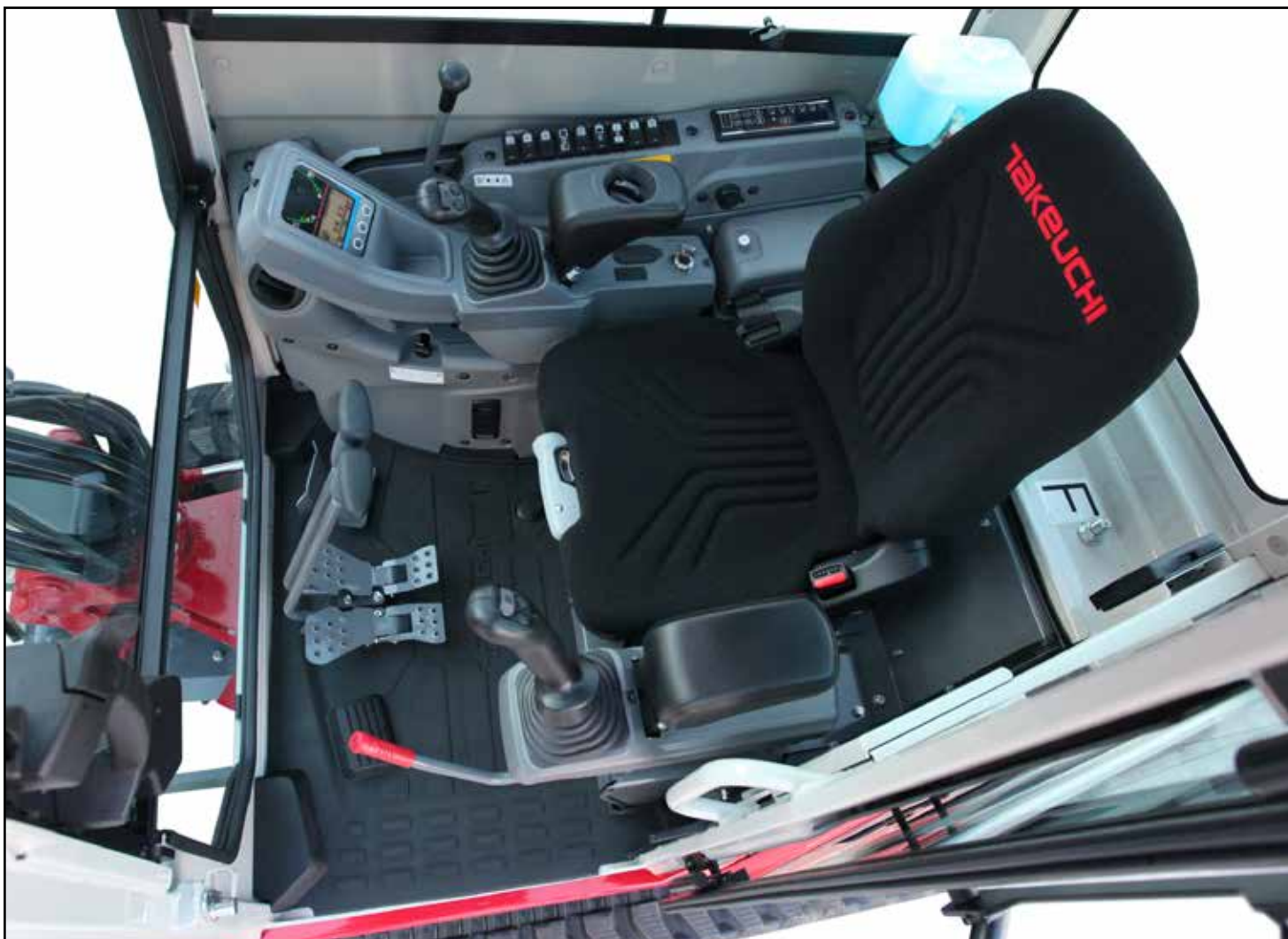
Romslig førerplass med lett tilgjengelige betjeningsfunksjoner

Som standardutstyr på TB325R inngår blant annet et automatisk luftesystem for drivstoff, som eliminerer behovet for manuell lufting av drivstoffsystemet, tomgangsautomatikk for lavere drivstofforbruk, drenering i gulvet for enklere rengjøring, samt en integrert motvekt som beskytter viktige maskinkomponenter. Andre funksjoner på TB325R er en lyspakke med LED-arbeidslys og flere kretser for ekstrahydraulikk. Som tilvalg finnes også telematikkssystemet Takeuchi Fleet Management (TFM).