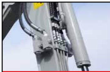
Innlil fire serviceporter (tilvalg)