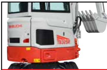
Bakdel med liten svingradius