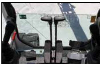
Romslig gulv med fotstøtte