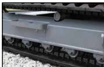
Trippelflens på underruller