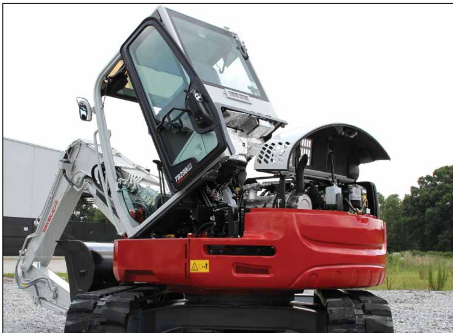
Nedfellbar hytte og store, låsbare serviceluker gir lett adgang for service og vedlikehold.

arbeide innenfor samme plassbegrensinger som en mindre 5-tonnsmaskin, men med høyere ytelse og produktivitet. Andre egenskaper er en oppdatert hytte med interiør med personbilkomfort, flerfunksjonsdisplay i farger, førerinnstillinger for flere redskaper hvor strømmingen stilles inn fra førerplassen, ekstrahydraulikkretser 1 og 2 som standard for en rekke redskaper, bakskjær og nedfellbar hytte for lett tilgang ved service.