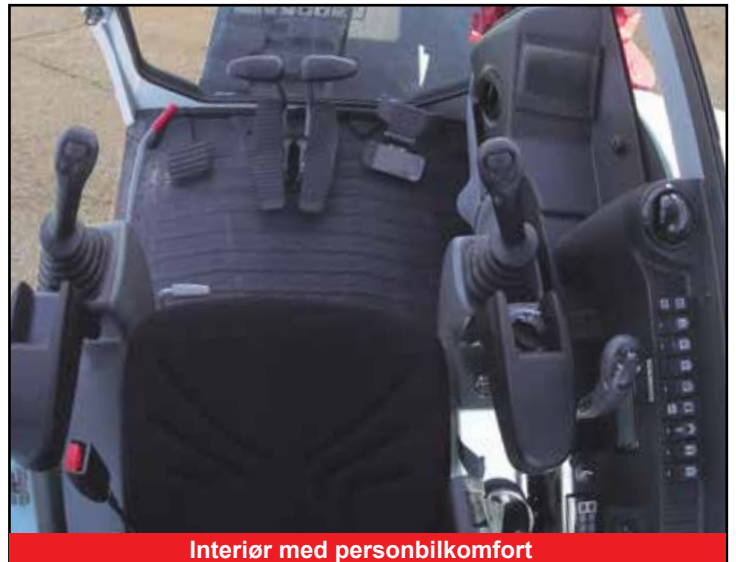
Interiør med personbilkomfort

*Funksjonene kan være utilgjengelige i noen land. Kontakt din Takeuchi-forhandler for mer informasjon.