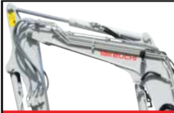
Flere hydrauliske kretser