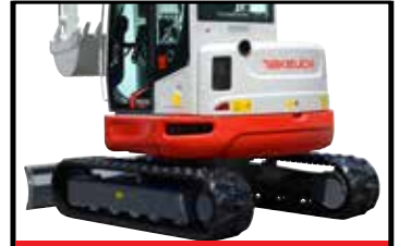
Klassens beste trekraft

TB257FR er det nyeste tilskuddet i Takeuchis FR-serie. Maskinen har samme sideforskyvbare bom (STS) og minimale svingradius som TB280FR. TB257FR har en kraftig, turboladet motor som oppfyller utslippskravene i henhold til EU nivå V/US Tier 4 og leverer 32 % høyere motoreffekt enn forgjengeren TB153FR. Til og med den hydrauliske ytelsen er forbedret, med en økning i trekraften på 19 %, høyere hydraulikkstrømming og høyere trykk i hovedsystemet.