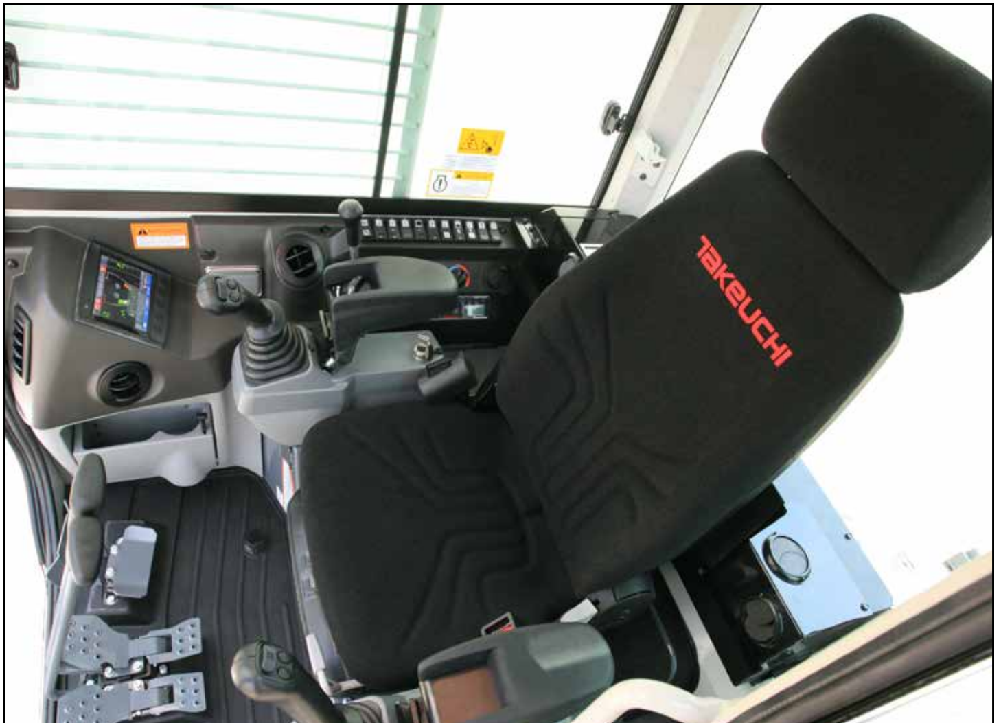
Helt nytviklet, romslig hytte med lett anvendbare funksjoner for operatøren

Service- og vedlikeholdsvennlighet er kraftig forbedret, og maskinens hytte kan felles fram for enklere adkomst til hydraulikkanleggets styringsventil, samt svingmotoren og svingkransen. Dessuten har motvekten fått en ny utforming for å gi bedre adkomst til motoen for daglige vedlikeholdskontroller og service.