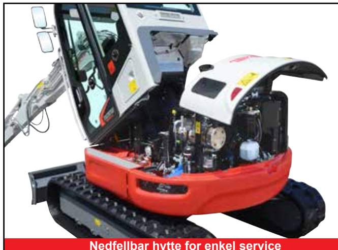
Nedfellbar hytte for enkel service

*Funksjonene kan være utilgjengelige i noen land. Kontakt din Takeuchi-forhandler for mer informasjon.