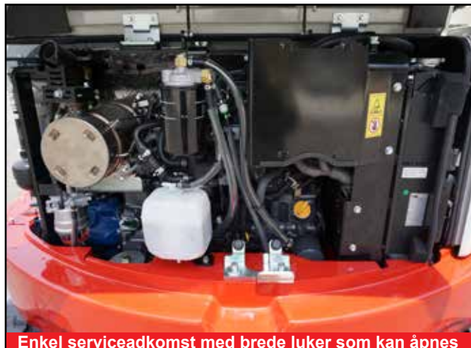
Enkel serviceadkomst med brede luker som kan åpnes