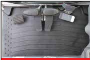
Romslig gulv med fotstøtte