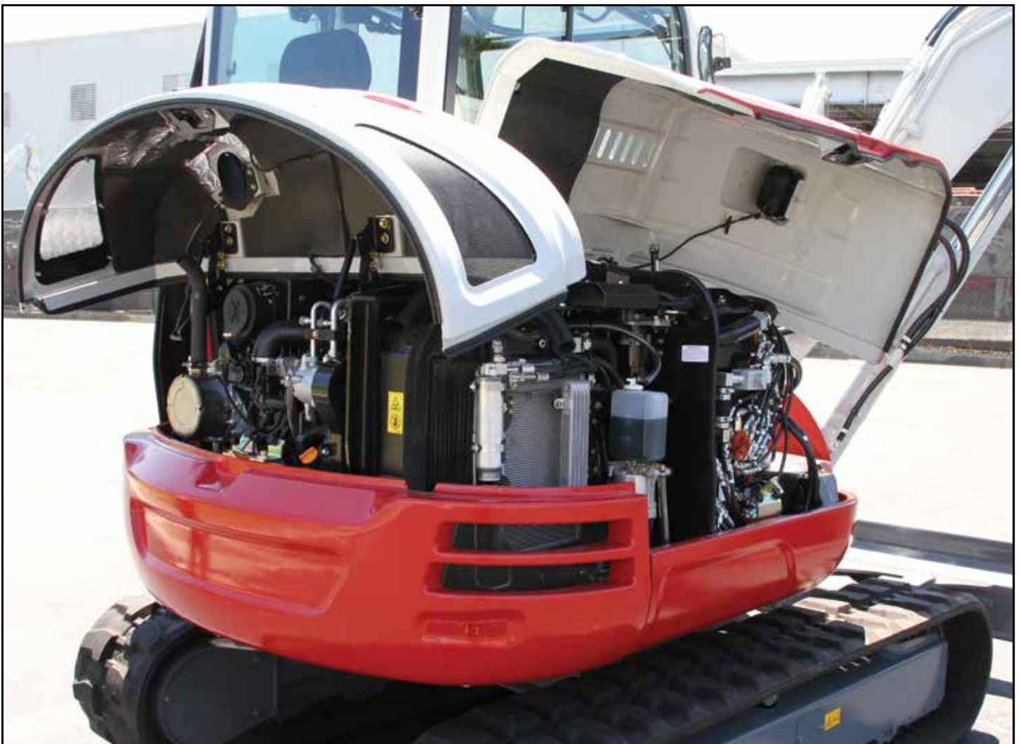
Store, låsbare serviceluker gir beskyttelse mot herværk og enstående adkomst for vedlikehold

Maskinen har et interiør med høy grad av komfort for føreren, og pilotstyrte spaker, store kjørepedaler, lett tilgjengelige vippebrytere og gassregulator i form av en vribryter.