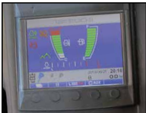
Display i hytte