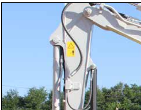
2 stk. hydrauliske kretser