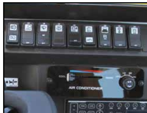
Lett tilgjengelige knapper