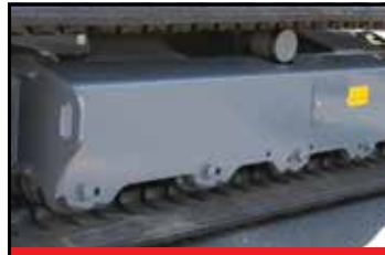
Trippelflens på underruller