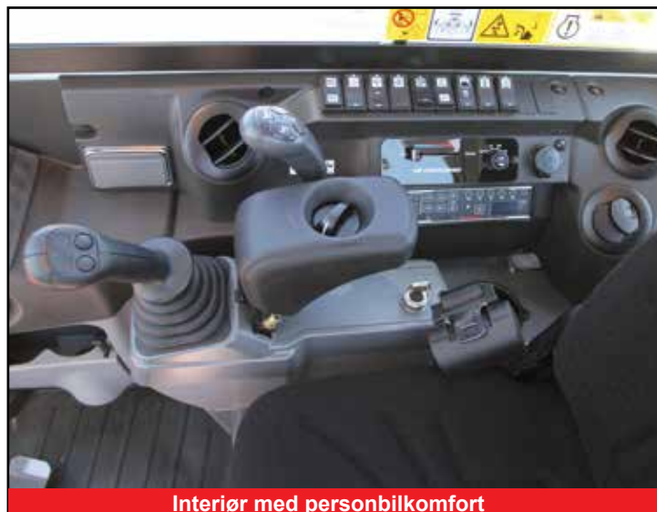
Interiør med personbilkomfort

*Funksjonene kan være utilgjengelige i noen land. Kontakt din Takeuchi-forhandler for mer informasjon