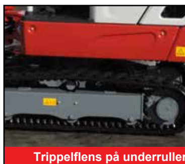
Trippelflens på underruller