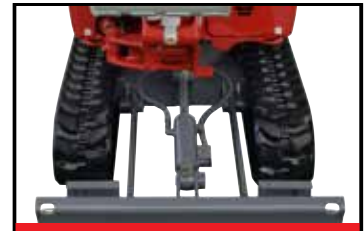
Hydraulisk justering av sporvidde

TB225 er en robust konstruksjon, og har en romslig førerplass med smidige hydrauliske styrespaker som gir nøyaktig respons. TB225 har klassens beste motoreffekt for mer kraft og høyere produktivitet.