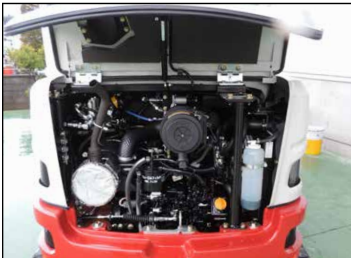
Store, låsbare serviceluker gir adgang fra bakkenivå