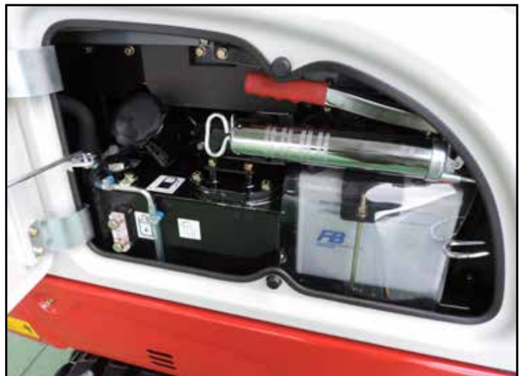
Enkel adgang for service og vedlikehold

*Funksjonene kan være utilgjengelige i noen land. Kontakt din Takeuchi-forhandler for mer informasjon