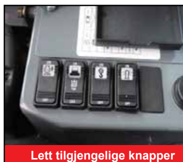
Lett tilgjengelige knapper