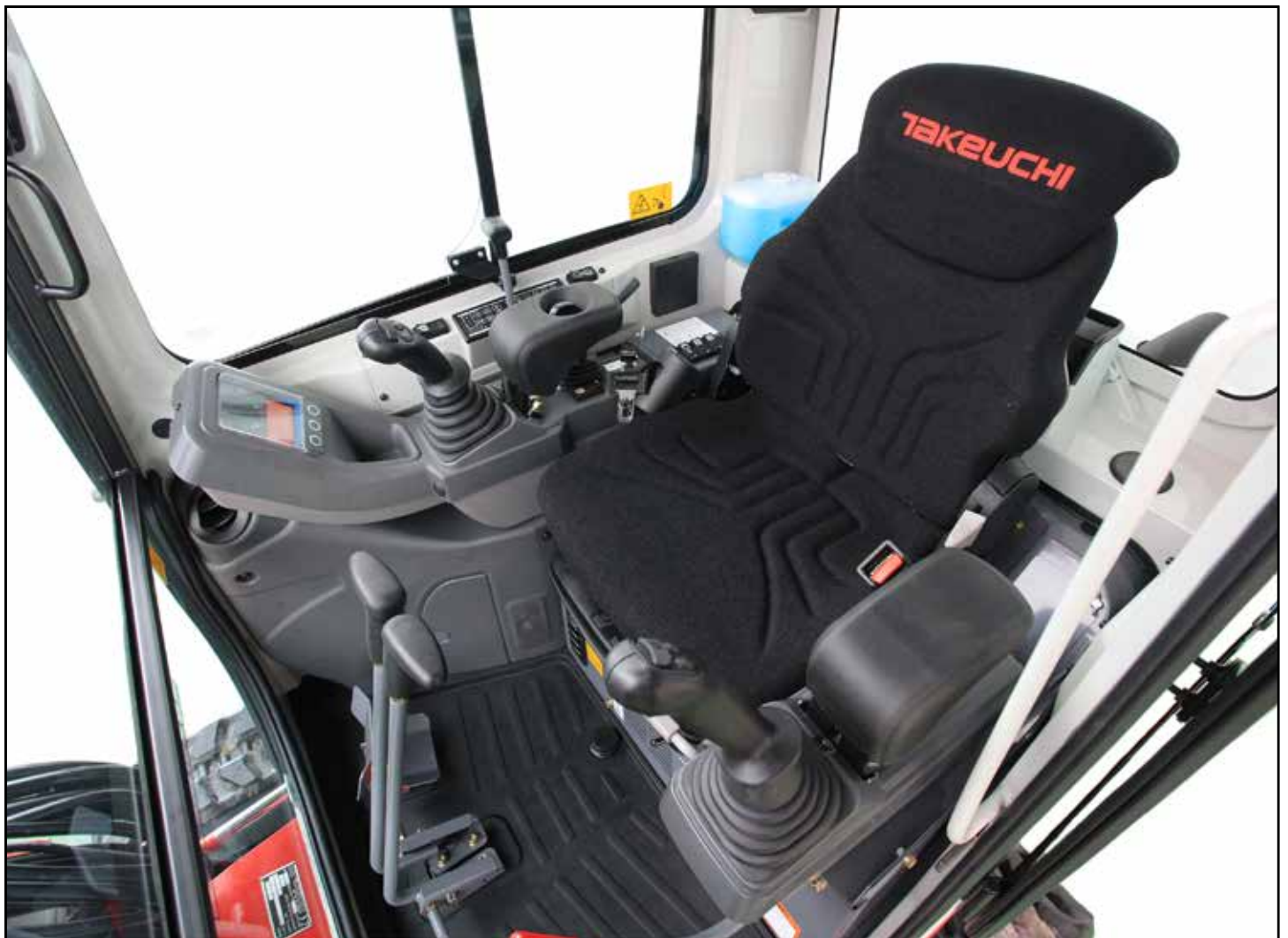
Romslig førerplass med lett tilgjengelige betjeningsfunksjoner

Føreren beskyttes av hytte og vernetak med ROPS/TOPS/OPG (Top Guard, nivå I) for best mulig sikkerhet og komfort på alle byggeplasser.