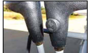
Kjøresystem med to hastigheter

TB210R har mange oppgraderinger for bedret komfort, effektivitet og servicevennlighet. For bedre presisjon i manøvreringen og mindre trettende arbeid, har TB210R nå joysticks med god respons, som er mindre anstrengende å betjene.