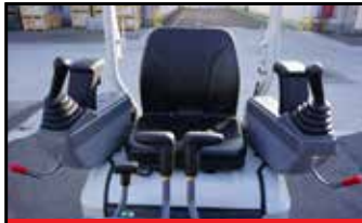
Justerbar spak-konsoll som tilvalg