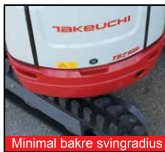
Minimal bakre svingradius