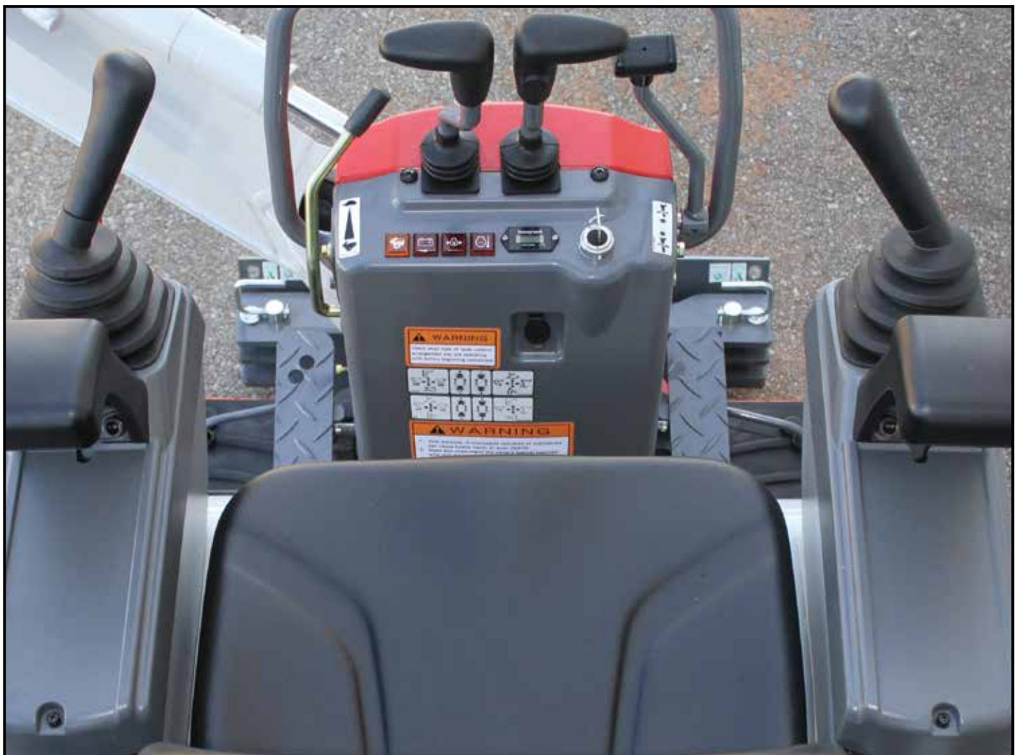
Romslig førerplass med nye styrespaker

For å minske sannsynligheten for kollisjon ved svinging av bakparten har TB210R dessuten liten svingradius bak. Maskinen gir enestående lett tilgang for service til tross for de kompakte målene, takket være oppfellbar setesokkel og servicepaneler.