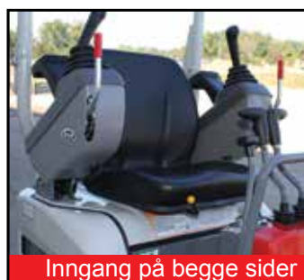
Inngang på begge sider