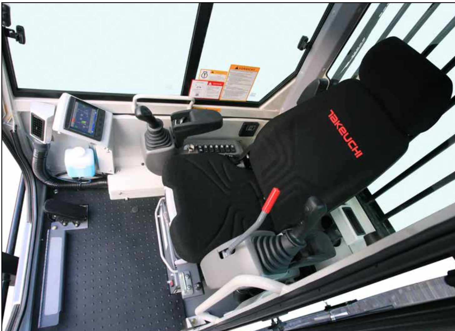
Interiør med personbilkomfort og lett tilgjengelige betjeningsfunksjoner

En serviceluke som åpner bredt, gir utmerket adkomst til motoren og de vanligste servicepunktene. Den standardmonterte påfyllingspumpen gjør at føreren kan fylle drivstofftanken lettere og raskere.