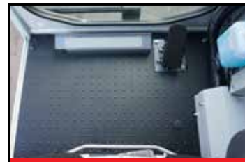
Stort gulv med fotpedal

Den nye beltedumperen TCR50-2 har flere funksjoner, samt bedre ytelse, komfort og servicevennlighet. Med en tømmevinkel på hele 65 grader og en maksimal lasteevne på 3 700 kg kan føreren flytte store mengder jord men en eneste bevegelse på planet. 180 graders dreibart plan for effektiv tømning sidelengs gjør at uerfarne førere ikke stadig må flytte maskinen, samt at reduserer slitasjen på gummibeltene.