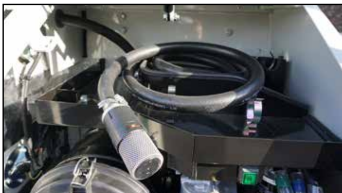
Påfyllingspumpe for drivstoff