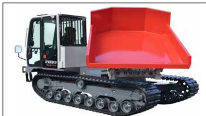
Plan med stor kapasitet