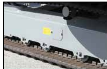
Trippel flens på underruller

Enkel transport og enestående arbeidskapasitet gjør TB235-2 til et utmerket valg for eiere/brukere, utleiebedrifter, allmenntilgjengelige foretak og hovedentreprenører. TB235-2 er bygget i stål, har en rommelig fører plass med personbilkomfort, og leveres med hytte med klimanlegg. Maskinen har enestående flerfunksjonshendler- og brytere, LED lyspakke, dempede bom- og svingsylindere for høyere prestasjoner, komfort og holdbarhet.