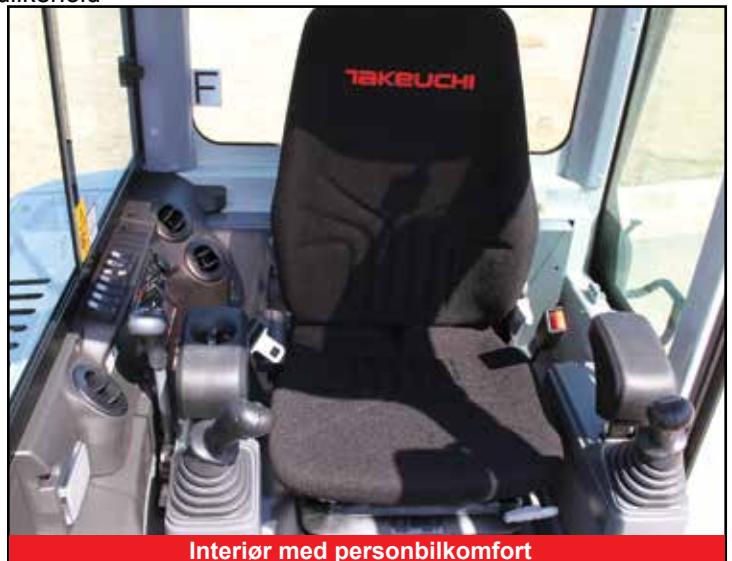
Interiør med personbilkomfort

*Funksjonene kan være utilgjengelige i noen land. Kontakt din Takeuchi-forhandler for mer informasjon