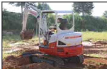
Bygget helt i stål