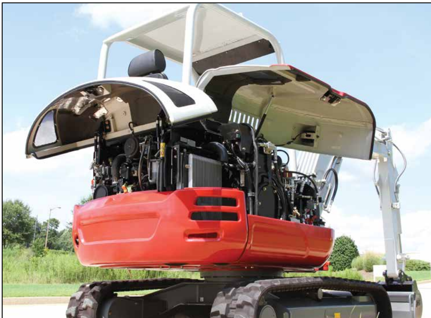
Låsbare serviceluker som kan åpnes oppover for enestående adkomst ved vedlikehold

Motoren i TB235-2 oppfyller kravene i de nyeste utslippsstandardene og har ikke dieselpartikkelfilter for enklere vedlikehold. Andre egenskaper er automatisk luftesystem for drivstoffanlegget, luftfilter med doble elementer (tilvalg), stor integrert motvekt og enestående servicevennlighet takket være motorluke og sideluke som kan åpnes oppover for større bekvemmelighet. Føreren er beskyttet av hytte eller vernetak med ROPS/TOPS/OPG (Top Guard, nivå I) for høyeste grad av sikkerhet og komfort.