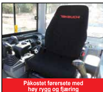
Påkostet fører sete med høy rygg og fjæring