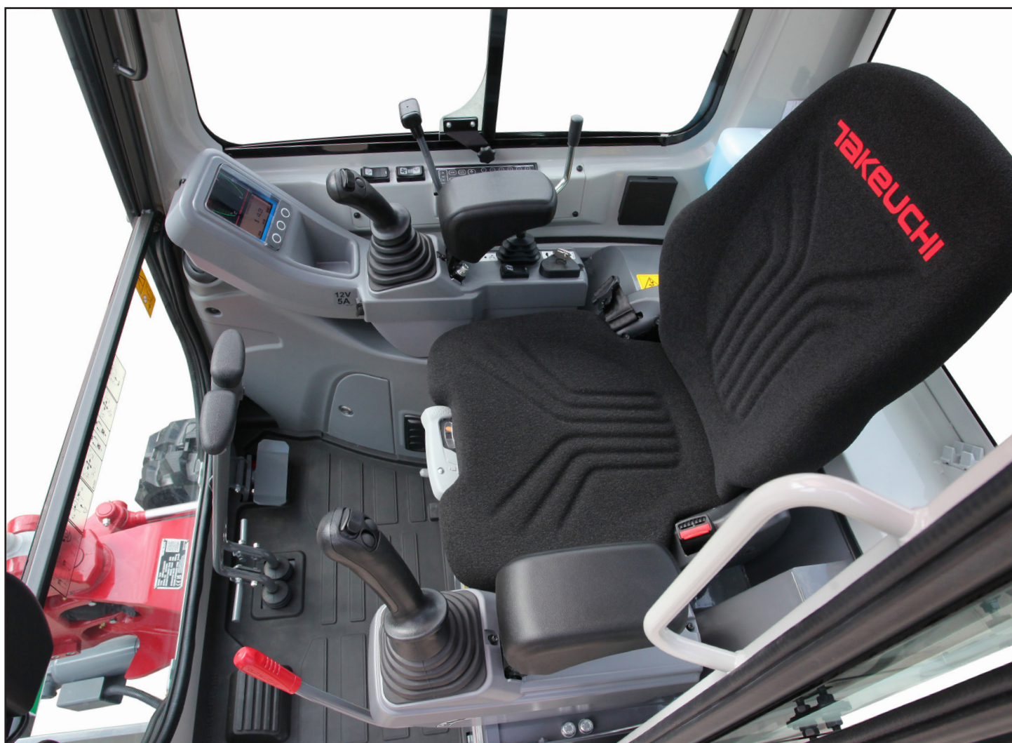
Romslig interiør med personbilkomfort, med intuitive betjeningsfunksjoner

TB320 er en konvensjonell gravemaskin med baksving, som gir en meget stabil plattform med utmerket løftekapasitet. Det er også tilgjengelig opptil fire hydrauliske hjelpekretser, som gjør det enkelt å legge til hydraulisk drevet utstyr. Primærkretsen har den kraftigste oljeleveransen i klassen, på opptil 40 l/min, og den styres ved hjelp av en proporsjonalbryter plassert på venstre joystick som lar operatøren styre oljeleveransen til redskapet.