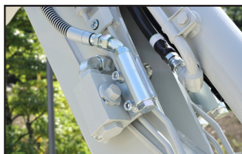
Flere serviceporter (inntil 4)