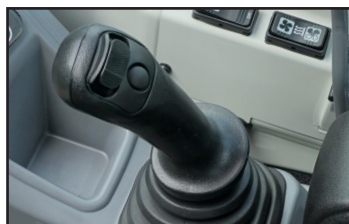
Joystick for hydraulikk