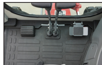
Stort gulv med fotstøtte

Takeuchi TB320 er en maskin som er designet for spesifikke og krevende bruksområder, og har mange innovasjoner innen ytelse og teknologi som gjør den til en ekstremt allsidig og produktiv maskin. Den er lett å transportere, og godt egnet for arbeid innen en lang rekke bruksområder, fra urbane byggeplasser til områder med begrenset tilgang, som rundt bedrifter, leiligheter og boliger.