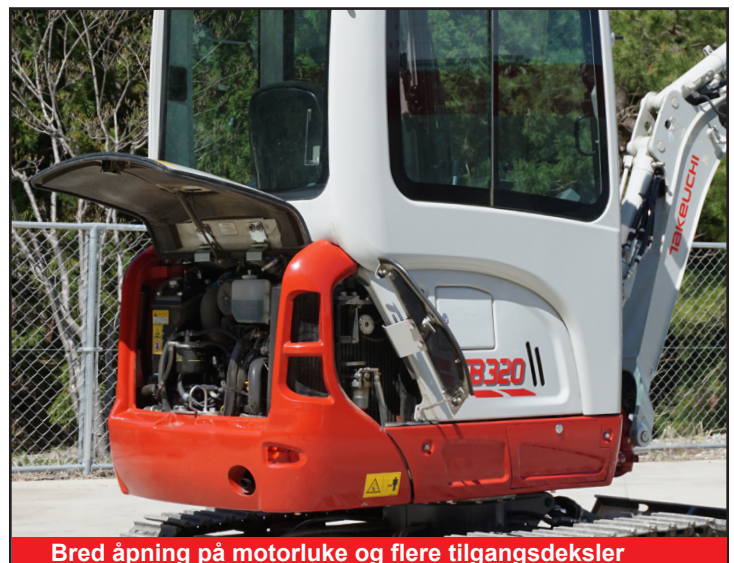
Bred åpning på motorluke og flere tilgangsdeksler

*Noen funksjoner er ikke tilgjengelige i alle land. Konsulter din Takeuchi forhandler for detaljer.