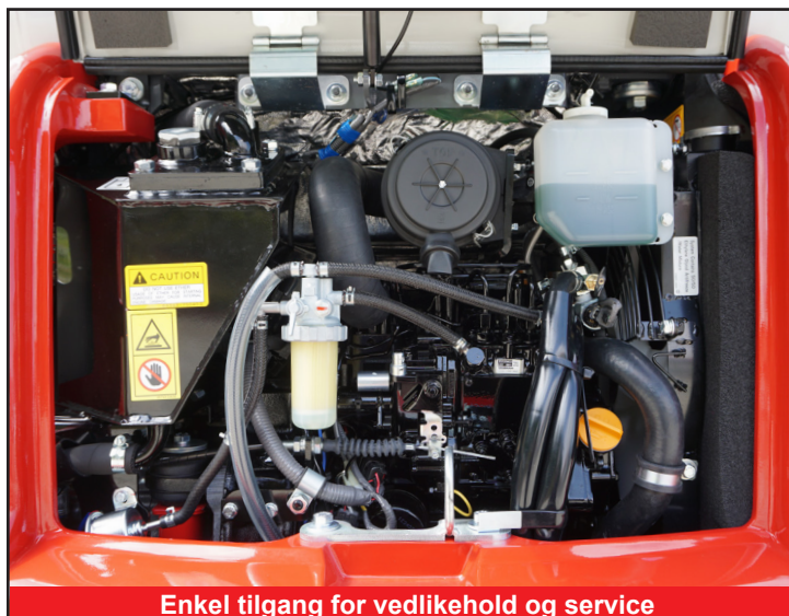
Enkel tilgang for vedlikehold og service